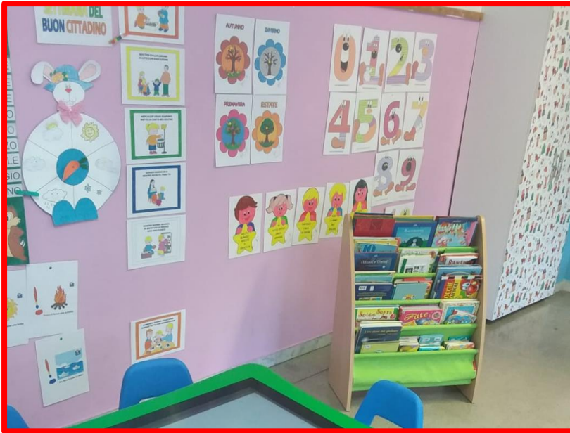
Biblioteca montessoriana di sezione- Scuola dell'Infanzia